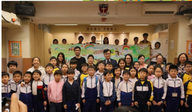
聖公會聖馬太小學閱讀專題活動