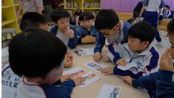
聖公會聖彼得小學閱讀專題活動