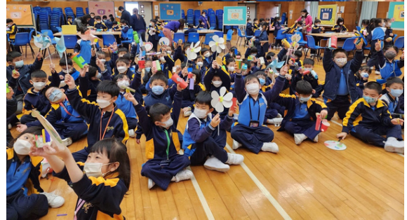
愛秩序灣官立小學主題學習週