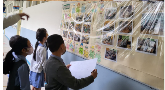
東華三院李賜豪小學『小小KOL訓練班』